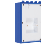
CAJA TRASERA Y PLACA EUROPEA DE MONTAJE SELLADA