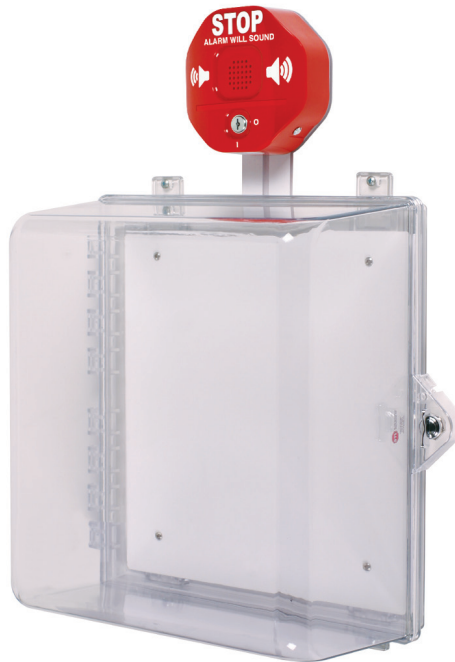
STI-7533 con Cerradura con perilla de accionamiento manual