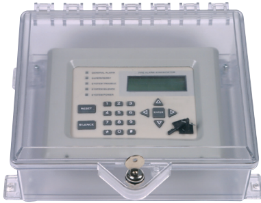
STI-7520 con Cerradura con Llave