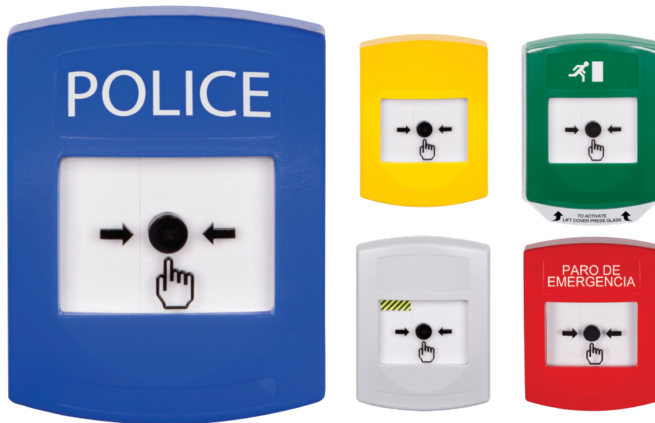
POLICE (policía) es un ejemplo de una etiqueta personalizada